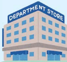
デパート・スーパー