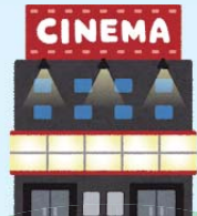
コンサート会場 映画館