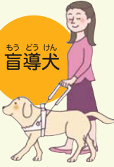
もう どう けん 盲導犬