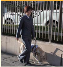
みち はし ある 道の端を歩く