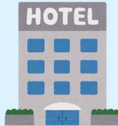
ホテル・旅館など