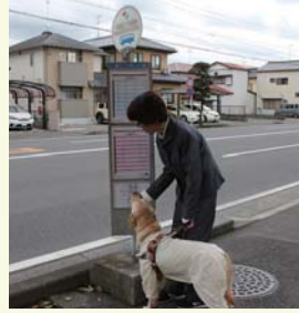
てい し バス停を知らせる