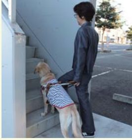
かいだん し 階段を知らせる