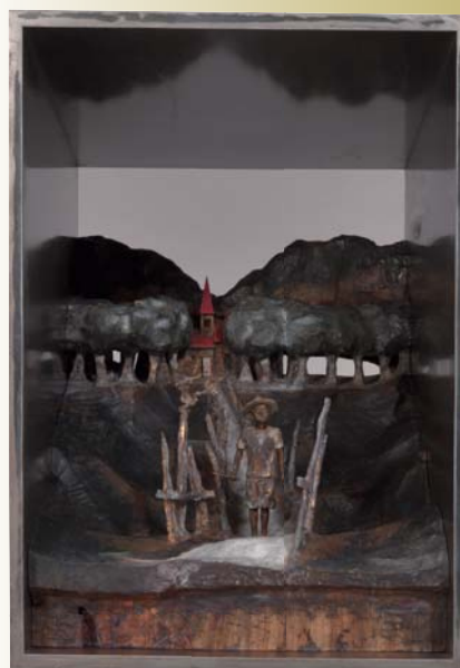
▲白い道—日本のうた 「どんがり帽子」